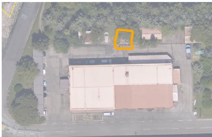
Slika 3: Lokacija toplotne črpalke – terminal za razsute tovore

Vgradnja toplotne črpalke je predvidena na zemljiških parcelah 356, k.o. Ankaran, ob upravni stavbi terminala za razsute tovore, Luka Koper d.d.