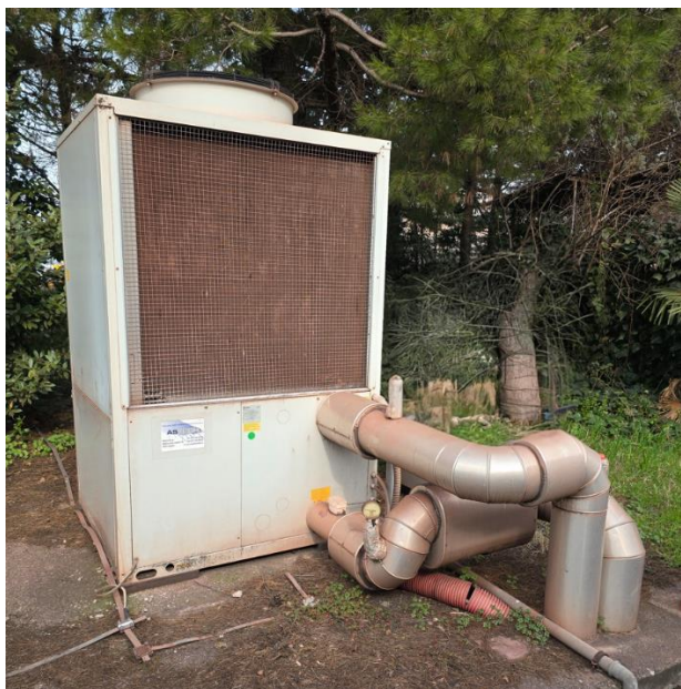
Slika 1: Obstoječa nedelujoča toplotna črpalka